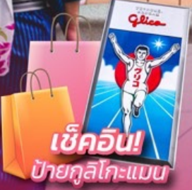
เช็ควิน! ป้ายกูลิโกะแมน