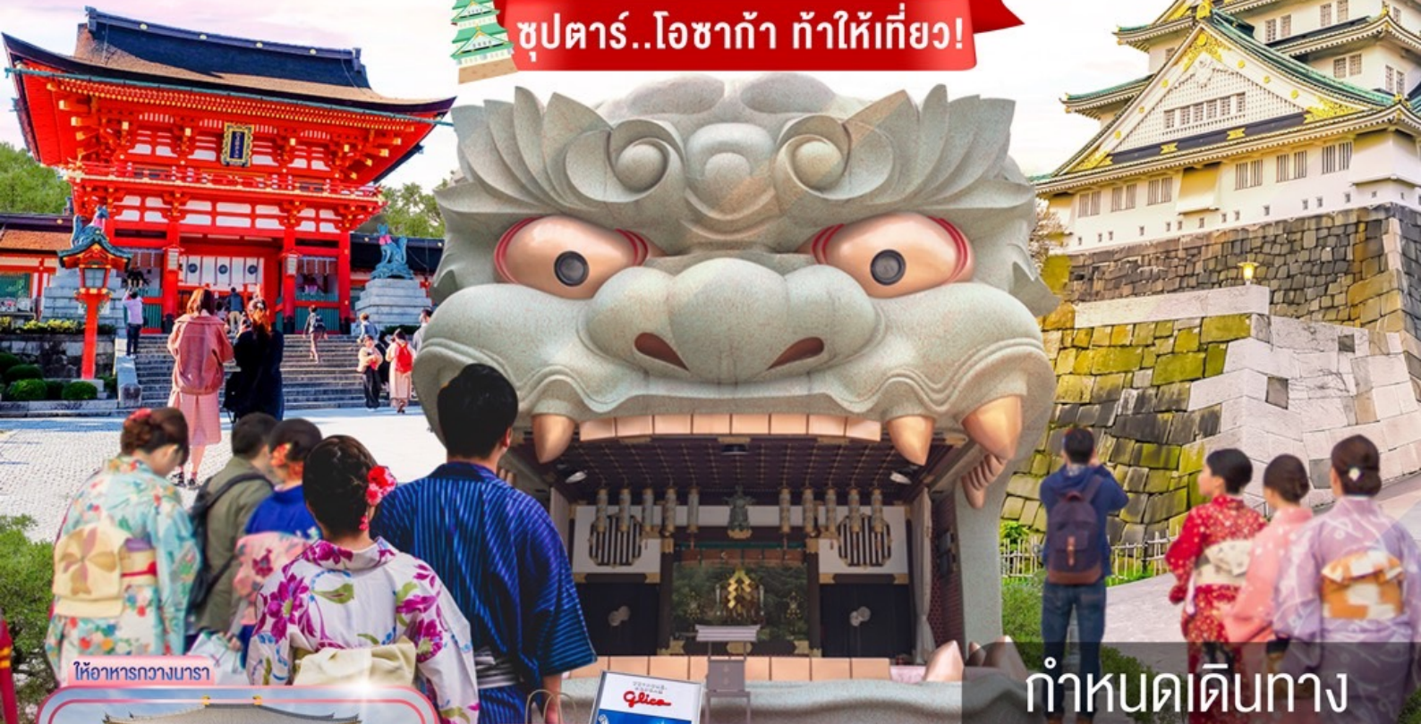
ให้อาหารกลางวัน