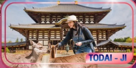
TODAI - JI