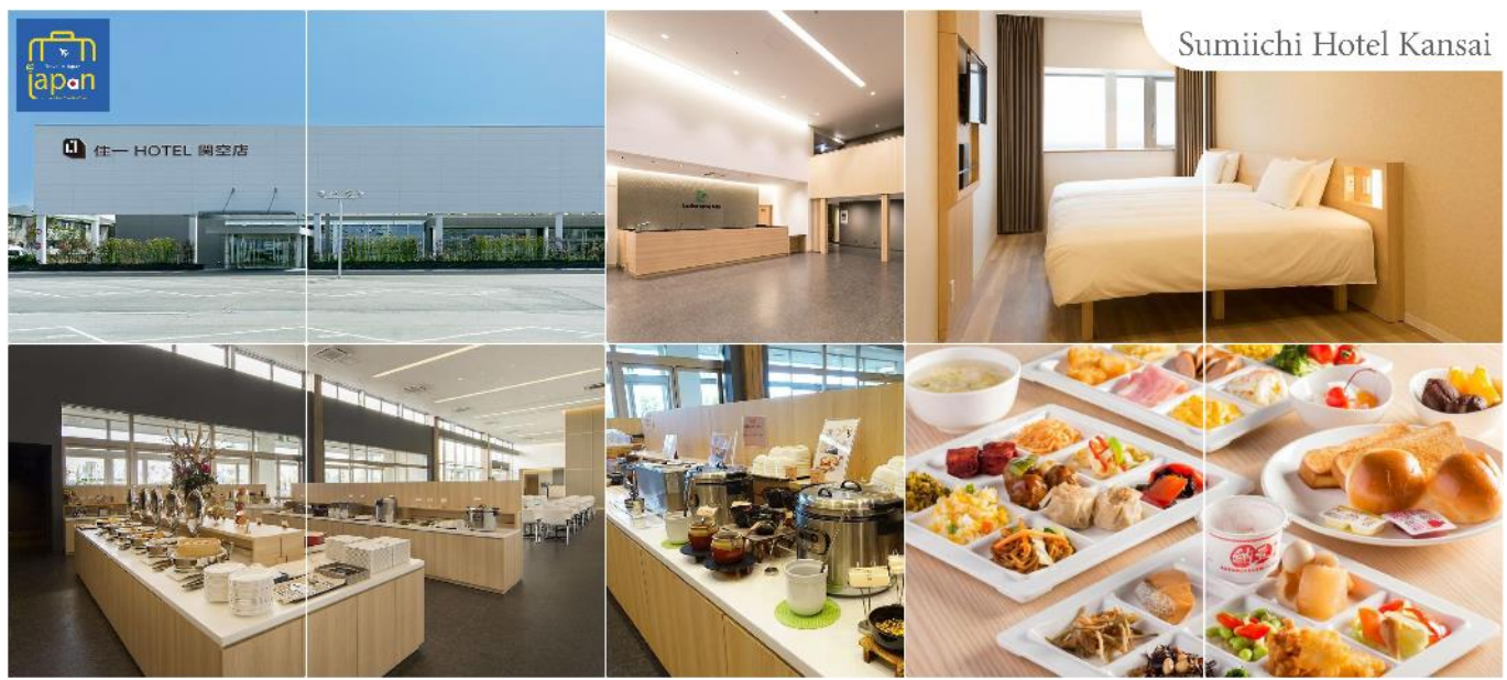
Sumiichi Hotel Kansai

พักที่ SUMIICHI HOTEL KANSAI หรือเทียบเท่าระดับเดียวกัน