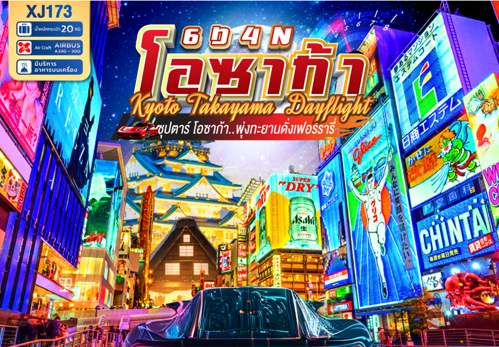
หมู่บ้านมรดกโลก