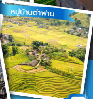
หมู่บ้านต้าฟาน