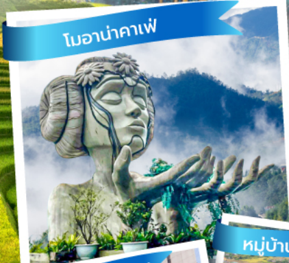
โมอานาคาเฟ่