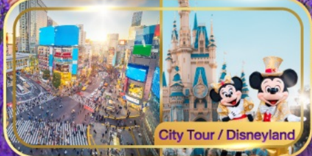
City Tour / Disneyland