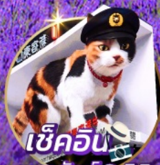
เช็คอิน แมวยักษ์ 3 มิติ