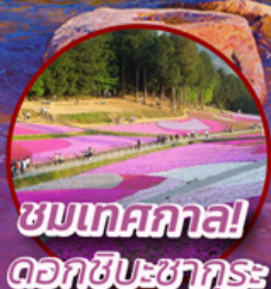
ชมเทศกาล ดอกชิบะซากุระ

📍 ไฮไลท์!! หุบเขาในฝัน คามิโคจิ ที่อยู่สูงชันทางเหนือเทือกเขาแอลป์ สัมผัสความงามของดอกชิบะซากุระ (Shibazakura Festival 2024) ย้อนยุคหมู่บ้านเอโดะ-จิ๋ว ณ เมืองเก้คาวาโกเอะ หมู่บ้านโอชิโนะฮัคโค **อิสระฟรีเดย์ ซอปปิง สนุก หรือ ท่องเที่ยวกรุงโตเกียว 1 วัน เต็ม**