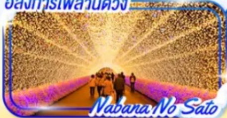
Nabana No Sato