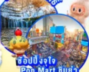
ช้อปปิ้งจ๊อ Pop Mart ชิบูย่า