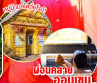
พักผ่อนคลาย ออนเซน..

ไฮไลท์!! เมืองในฝันสไตล์ยุโรปในประเทศญี่ปุ่น HUIS TEN BOSCH สัมผัสความยิ่งใหญ่ ปราสาทคามาโมโตะ: 1 ใน 3 ปราสาทที่ใหญ่ที่สุดญี่ปุ่น พบกับ ถิ่นคัมภีร์ใหม่ขนาดเท่าของจริง ณ ถิ่นคัมภีร์ ปาร์ค ฟุกุโอกะ ชม บ่อนรก จิโกกุ เมกุริ บ่อนรกแห่งเมืองเบปปุ อ่างน้ำแร่ธรรมชาติ (ออนเซน)