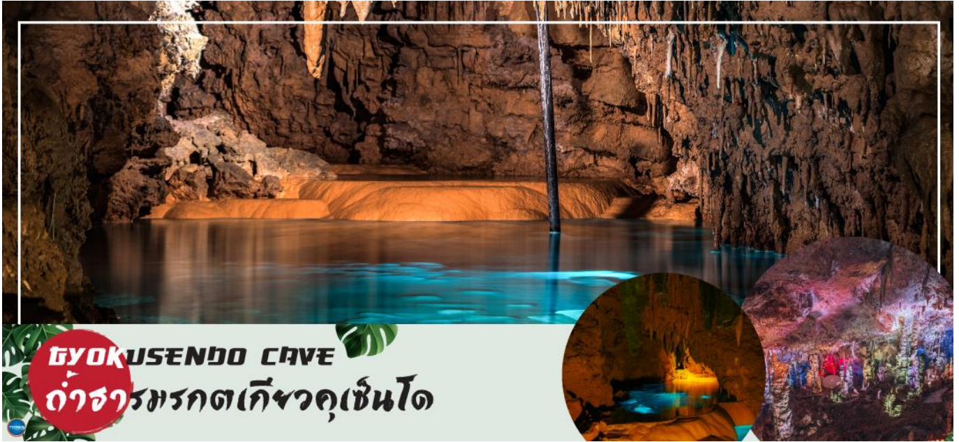
GYOKUSENDO CAVE ถ้ำจรมรกตเก็ซวคฺเซินโด

ไม่ได้ใช้แบบขึ้นรูป มีสีสันสดใส ด้วยฝีมือช่างผู้ชำนาญ ชมช่างทำแก้ว ในขณะที่งานสร้างเครื่องแก้ว ที่เป็นการสร้างสรรค์ด้วยฝีมือของช่างแต่ละคน ชมห้องจัดแสดงผลงานเครื่องแก้ว และให้ท่านสามารถเลือกซื้อเครื่องแก้วที่ท่านถูกใจได้