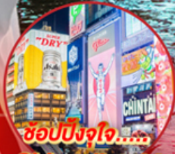
ช้อปปิ้งจุใจ..... Shinsalbashi

📍 โอโคโน! ชมใบไม้เปลี่ยนสีที่สวยงามที่สุดในภูมิภาค ณ หมู่เขาโคริงเค อสังการไฟลันดวณ ณ หมู่บ้านนาบะโนะ โนะ ซาโตะ ชม หมู่บ้านมรดกโลกการ์นตีโดย UNESCO ณ หมู่บ้านชิราคาวาโตะ ปราสาทมัตสึโมโตะ เป็น 1 ใน 12 ปราสาทดั้งเดิมที่ยังคงสมบูรณ์และสวยงาม ชมสวนสไตล์ญี่ปุ่น และเยือน วัดกินคะคุจิ หรือ วัดเงิน แห่งเมืองเกียวโต