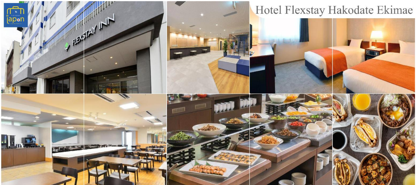
Hotel Flexstay Hakodate Ekimae

FLEX STAY INN HAKODATE EKIMAE หรือเทียบเท่าระดับเดียวกัน