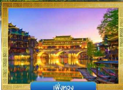
เฟิ่งหวง