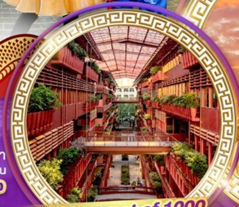
The street of 1000 red jars