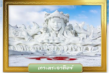
เกาะพระอาทิตย์