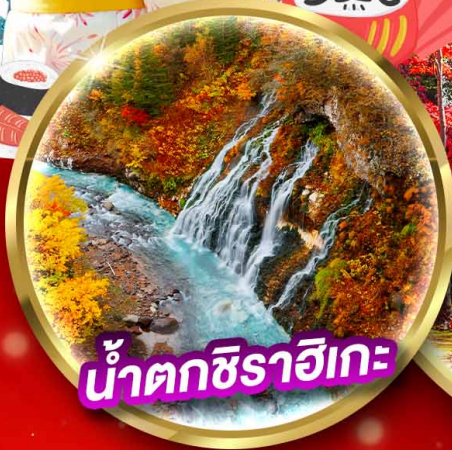
น้ำตกชิราอิเกะ