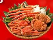
พิเศษ! ว่างู 3 ชนิด