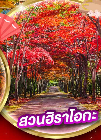
สวนอิราโอกะ