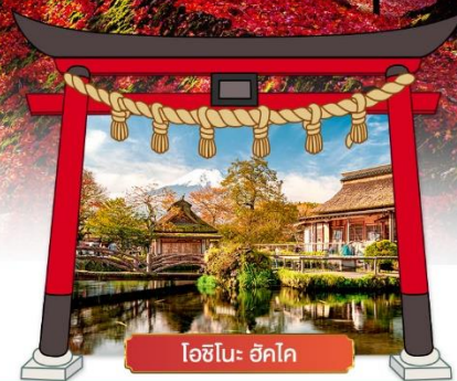
โอชิโนะ ฮักโค

เดินทางโดยสายการบิน : ไทยแอร์เอเชียเอ็กซ์