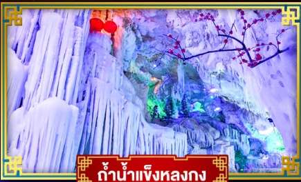
ก้าน้ำแข็งหลงกง

"เที่ยว 2 มณฑล กวางซี-กัชโจว" สุดอลังการ น้ำตก 2 พรมแดน แหล่งท่องเที่ยวระดับ 5A