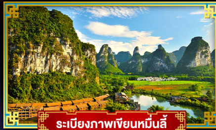
ระเบียบภาพเขียนหมื่นลี้