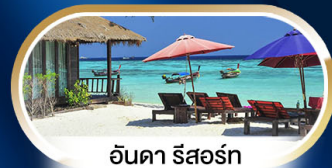
อินดา รีสอร์ท