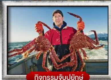
กิจกรรมจับปูยักษ์