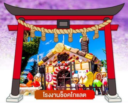
โรงงานช็อคโกแลต