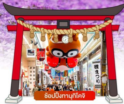
ช้อปปิ้งทานุกิโคจิ