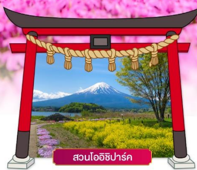
สวนโออิชิปาร์ค