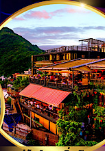
หมู่บ้านโบราณจิวเฟิน