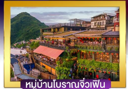
หมู่บ้านโบราณจิวเฟิน

อิมพอร์ตกับ Michelin Star เสี่ยวหลงเปา ปลาประจานาธิบดี