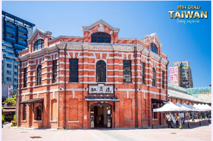
BEST GOLD TAIWAN บินทรู อยู่สบาย

หรือที่คนไทยรู้จักกันในนาม สยามสแควร์แห่งไทเปเป็นย่านช้อปปิ้งของวัยรุ่นและวัยทำงานของไต้หวัน ยังเป็นแหล่งช้อปปิ้งของนักท่องเที่ยวด้วยเช่นกัน ในย่านนี้เป็นถนนคนเดินโดยแบ่งโซนเป็นสีต่างๆ เช่น