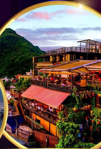
หมู่บ้านโบราณจิวเฟิน