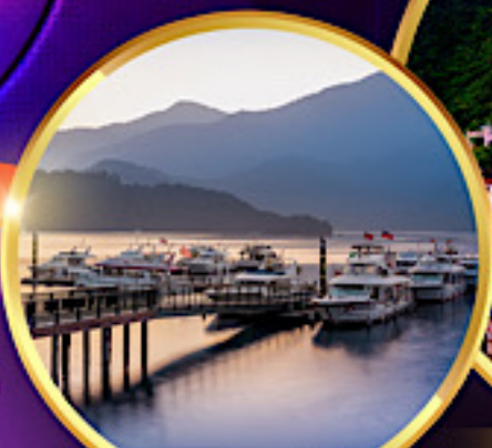
ล่องเรือทะเลสาบสุริยจันทร์