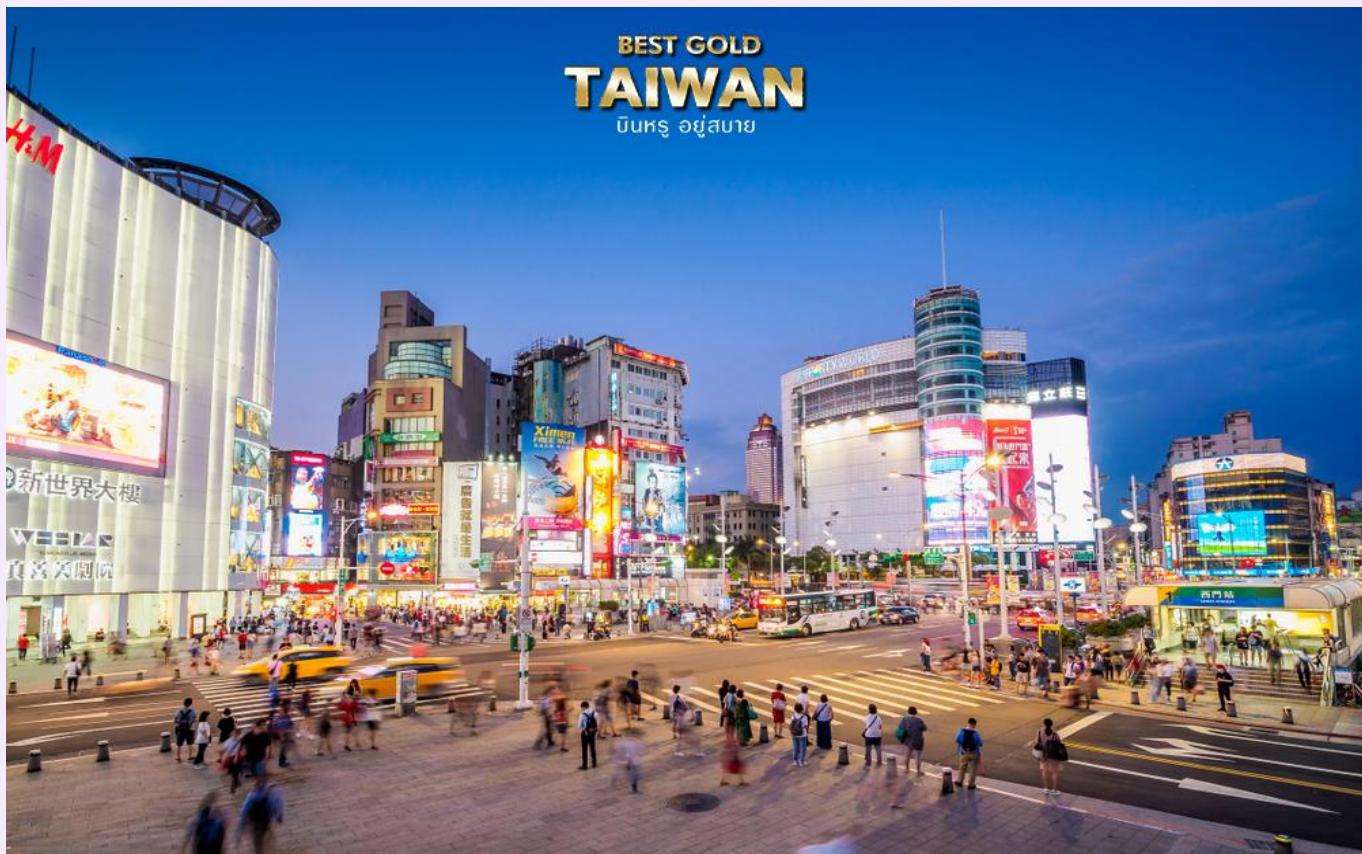
BEST GOLD TAIWAN บินทรู อยู่สบาย