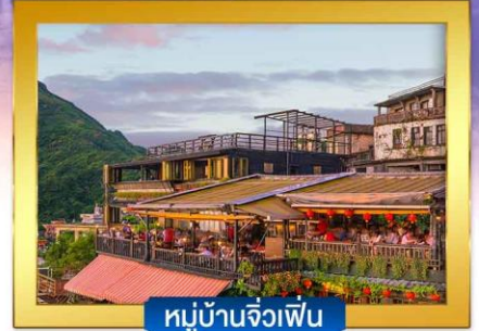
หมู่บ้านจิวเฟิ่น

พิเศษ !! บุฟเฟ่ต์ชาบูไต้หวัน , ปลาประธาราธิบดี, เสี่ยวหลงเปา , ไอศกรีม MIYAHARA