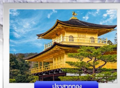
ปราสาททอง