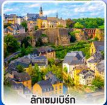
ลักเซมเบิร์ก