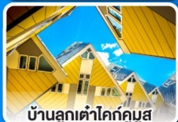
บ้านลูกเต่าโคกคูมูส