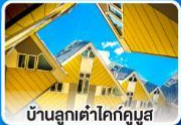
บ้านลูกเต่าโคกคูมูส

ล่องเรือ... ชมทัศนียภาพอันสวยงาม ตลอดสองฟากฝั่งของแม่น้ำไรน์