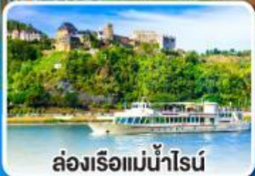
ล่องเรือแม่น้ำไรน์