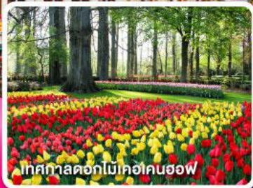
เทศกาลดอกไม้ที่อัมสเตอร์ดัม