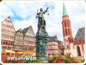
แฟรงก์เฟิร์ต