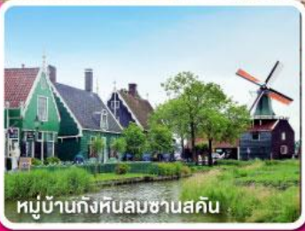
หมู่บ้านกังหันลมซานสคิน