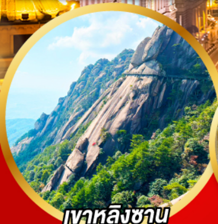
เวาหลิงซาน