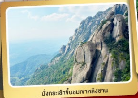
นั่งกระเช้าขึ้นชมเขาหลงซาน