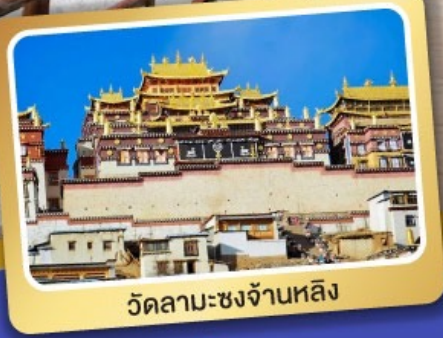
วัดลามะ-ชงจ้านหลิ่ง