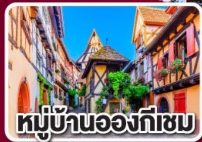
หมู่บ้านอองกีเซม