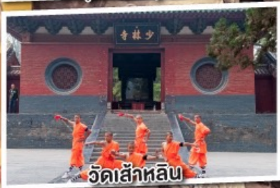
วัดเส้าหลิน