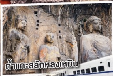
ถ้ำแกะสลักหลงเหมิน