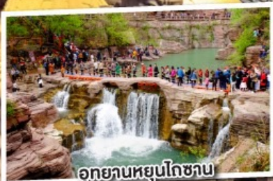
อุทยานหยุนโกซาน