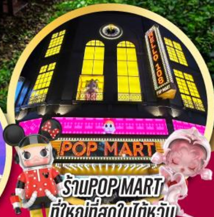
ร้านPOP MART ที่ใหญ่ที่สุดในไต้หวัน