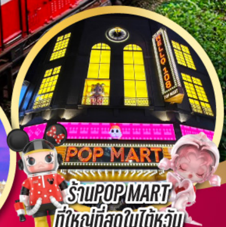
ร้าน POP MART ที่ใหญ่ที่สุดในไต้หวัน