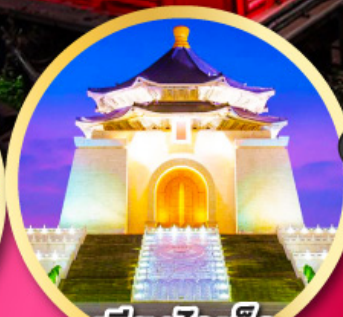
เจียงไคเช็ค