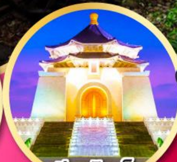
เจียงไคเช็ค