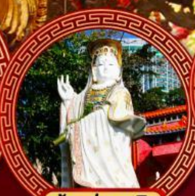
เจ้าแม่กวนอิม รีพัลส์เบย์