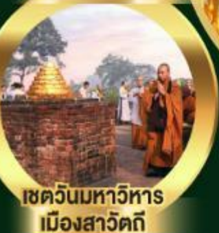
เขตวันมหาวิหาร เมืองสาวิตรี