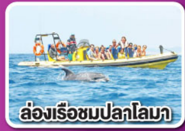
ล่องเรือชมปลาโลมา