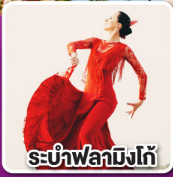
ระบำฟลามิงโก้

ล่องเรือชมความน่ารัก ตามธรรมชาติของฝูงโลมา