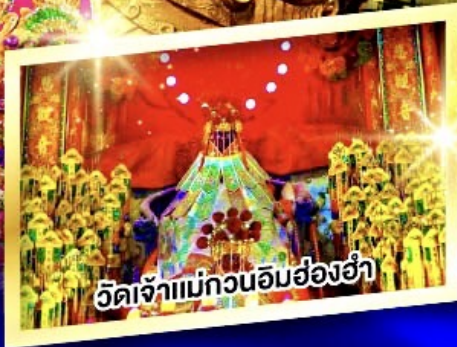
วัดเจ้าแม่กวนอิมฮ่องฮ่า