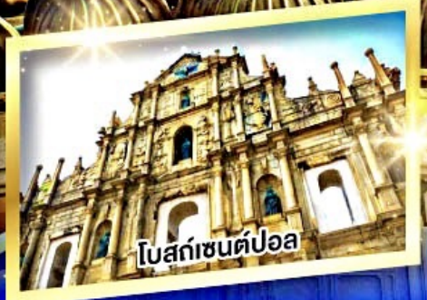
โบสถ์เซนต์ปอล

เมนูพิเศษ ห่านย่าง, ต้มข้าวฮ่องกง, บุฟเฟ่ต์สไตล์ฮ่องกง