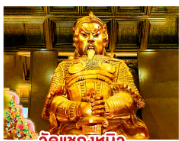
วัดแควงเหมียว