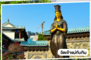
วัดเจ้าแม่กวนอิม