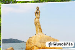
จูไห่พีซเซอร์เกิร์ล