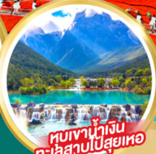
ชมเขาน้ำเงิน ทะเลสาบไป๋สือเหอ