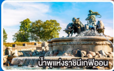
น้ำพุแห่งราชินีเคฟ็อน