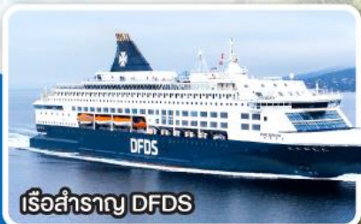
เรือสำราญ DFDS