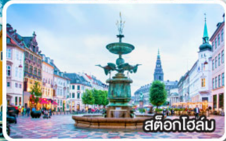
สต็อกโฮล์ม