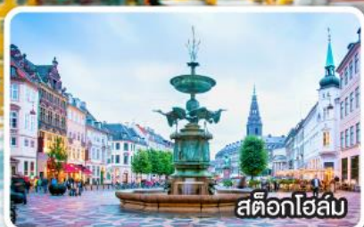
สต็อกโฮล์ม