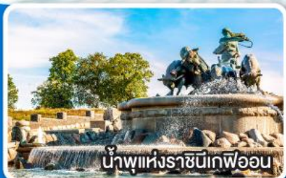
น้ำพุแห่งราชินีวิกตอเรีย