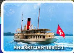
ล่องเรือทะเลสาบเจนีวา