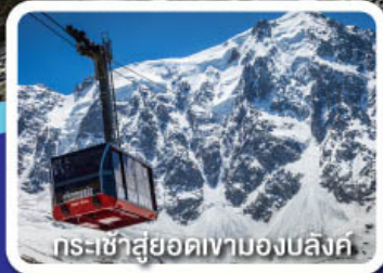
กระเช้าสู่ยอดเขามองบล็องค์