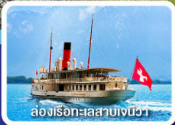
ล่องเรือทะเลสาบเจนีวา