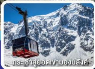
กระเช้าสู่ยอดเขามองบล็องค์

พิสุจน์ความสูง ของสองเงา Top of Europe ยอดเขาจุงเฟรา และยอดเขามองบล็องค์