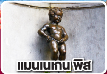
แมนเนเกน พิส