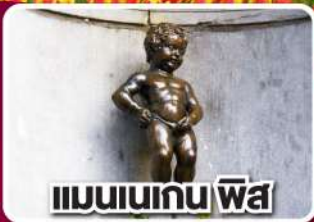
แมนเนเกน ฟิส