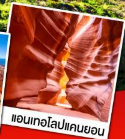
แอนเทอโลปแคนยอน