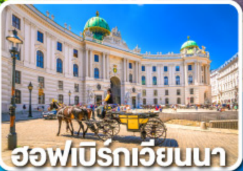
ฮอฟบิรท์เวียนนา