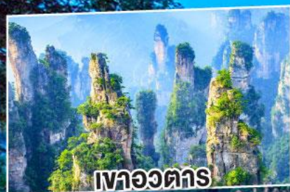
เขาวงตาร