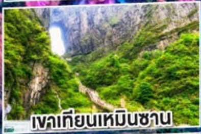
เทียนเหินซาน