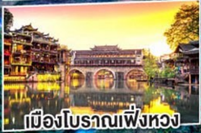
เมืองฝูหยาง