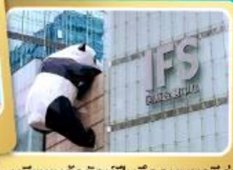
หมีแพนด้ายักษ์ปิ่นตึกถนนซูลซู่