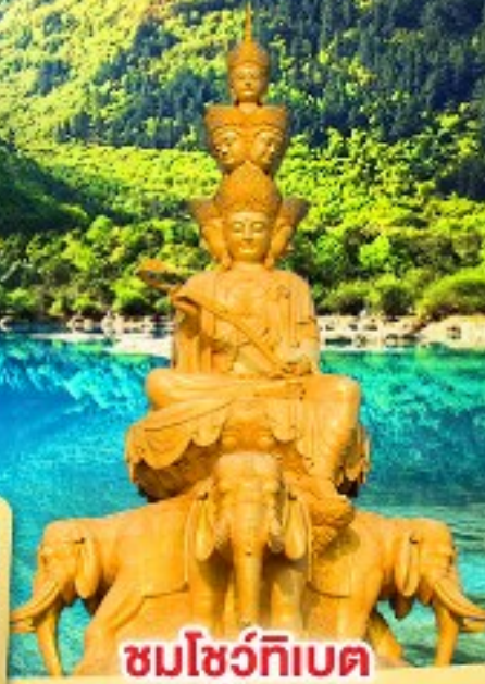
ชมโชว์ทิเบต ชมโชว์เปลี่ยนหน้ากาก