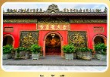
วัดต้าอื่อ