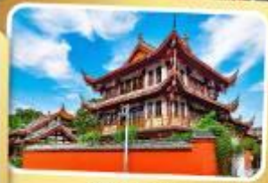
วัดเหวินชู่