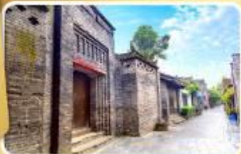
ถนนโบราณชอยกวางชอยแคบ