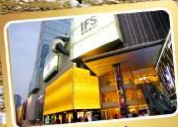
ถนนชุนชี่ลู่