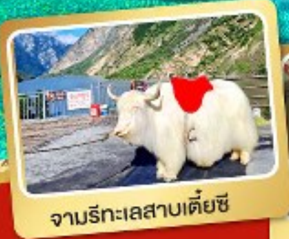
จามรีทะเลสาบเตี้ยซี