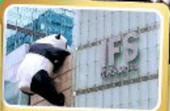
หมีแพนด้ายักษ์ป็นสัตว์ถนนซุนซี