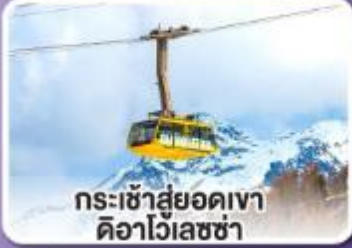
กระเช้าสู่ยอดเขา ดืออาไวเลซซา