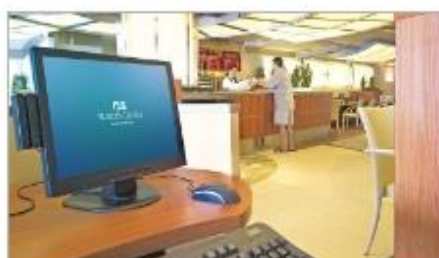
Internet Café & Library